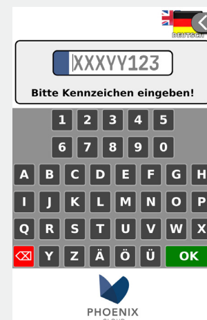
Abbildung 2 Ausfahrt: TRUST Eingabe bei unbekanntem Kennzeichen