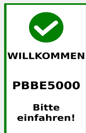
Abbildung 1 Einfahrt: Begrüßung des erkannten Kennzeichens